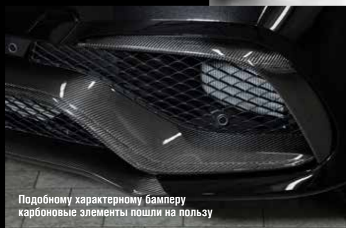
Подобному характерному бамперу карбоновые элементы пошли на пользу

Отдельной строкой можно упомянуть и антиподы – отсутствие вкуса у владельца, когда он лепит